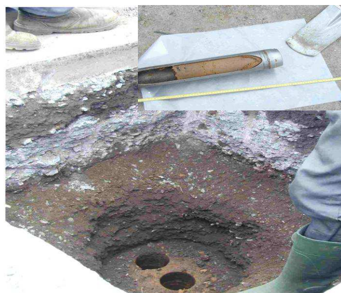
Photo 3 : Echantillonnage de sol sous-jacent par carottage dans une tranchée