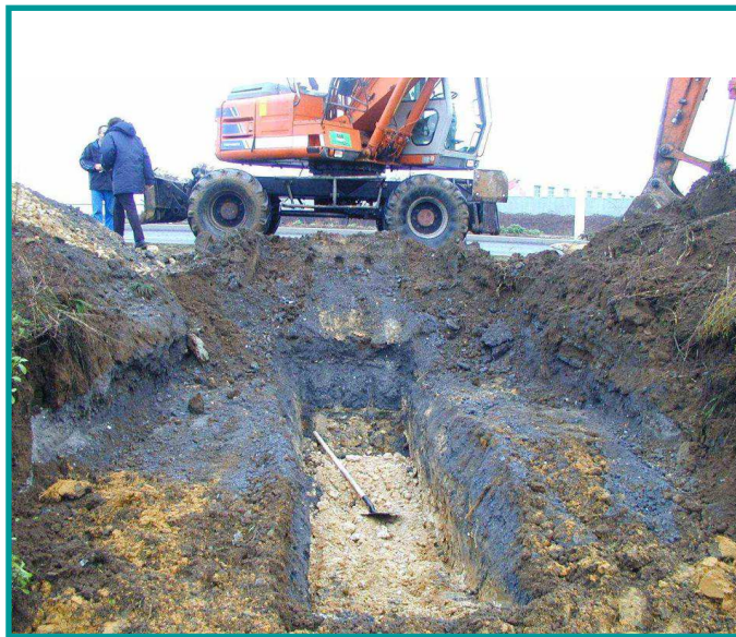
Photo 2 : Réalisation d'une tranchée à l'aide de la pelle mécanique