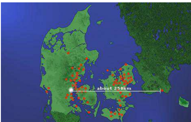
Figure 1 : accident de Kolding (Danemark, novembre 2004), localisation de l'accident et répartition géographique des points de perception sonore ou vibratoire.

Parmi les accidents graves, celui d'Enschede aux Pays-Bas en mai 2000 a toutefois été, en France comme dans le reste du monde, un signal d'alerte fort. Cet accident majeur, impliquant des artifices de divertissement, a occasionné 22 morts et plus de 900 blessés avec par ailleurs des dommages aux biens considérables dans une aire résidentielle : 1 000 maisons détruites ou sévèrement endommagées [2]. C'est d'ailleurs à la suite de cet accident, puis de celui de Toulouse en France en septembre 2001 [3] que la directive dite "Seveso II" [4] relative à la prévention des risques industriels majeurs a été révisée. En novembre 2004 au Danemark, l'accident de Kolding [5], [6], survenu en milieu péri-urbain, chez un distributeur local de feux d'artifices (une victime parmi les sapeurs-pompiers, de nombreuses personnes évacuées parmi la population) a rappelé la réalité des dangers présentés par ces produits dans les stockages en masses importantes (cf. figures 1 et 2).