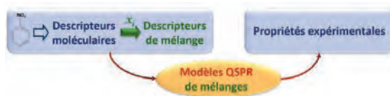
Fig1 Schéma de principe des modèles QSPR pour des mélanges